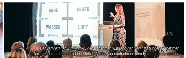
Der Veranstalter wird Foto-/Videoaufnahmen während den Veranstaltungen vornehmen. Den Teilnehmern ist es nicht gestattet, Audio-/Videoaufnahmen vom Referenten zu machen.