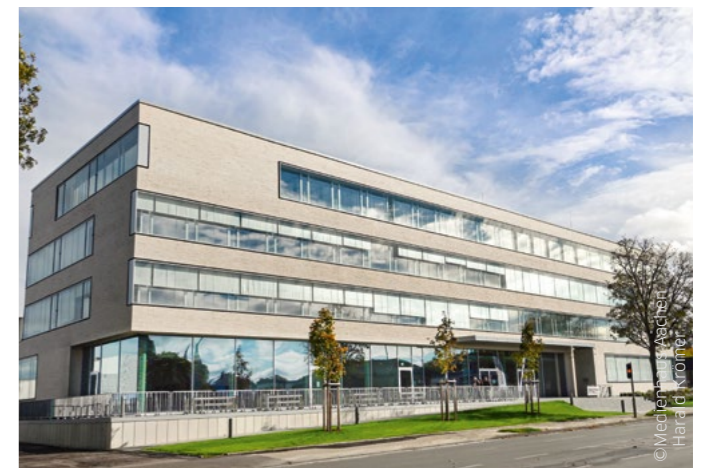
Halle 01/02/03

19.30 bis 21.00 Uhr Einlass ab 19:00 Uhr | Login ab 19:15 Uhr